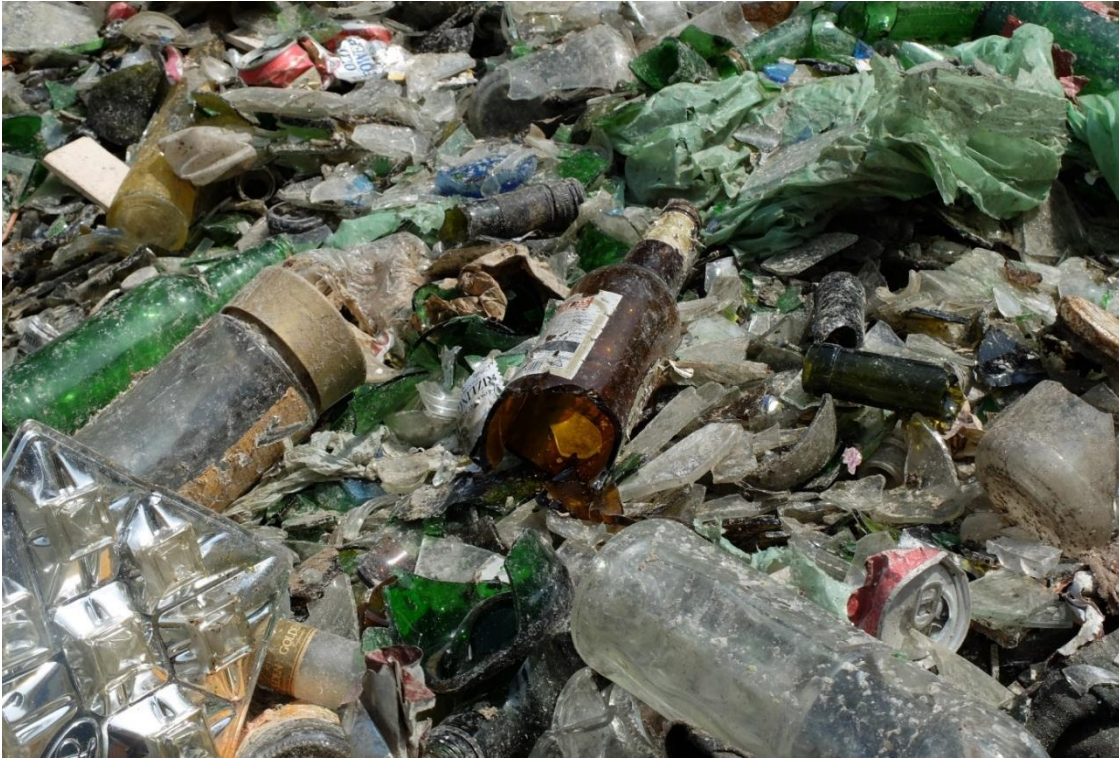
Obr. 3: FOTO: Denisa Rášová; vyzbierané sklo čakajúce na recykláciu v závode Vetropack v Nemšovej

Do skla PATRÍ biele (číre) a farebné sklo rôznej veľkosti (nevratné obaly z nápojov, poháre a pod.), črepy, úlomky tabuľového skla. Recyklovať sa dajú aj flakóniky od parfémov s kovovými a plastovými časťami, fľaše s etiketou alebo uzáverom . Sklo netreba ani oplachovať, súčasné recyklačné zariadenia si s tým hravo poradia a malé nečistoty a etikety zhoria pri vysokej teplote v taviacej peci. Väčšie kusy skla , ktoré sa nezmestia do zberných nádob, ako napríklad okenné tabule, sa odnášajú na zberný dvor . Vratné fľaše sa dajú v priemere naplniť až 30-krát , preto by sme ich mali, pochopiteľne, po ich použití vždy vrátiť naspäť do obchodov.