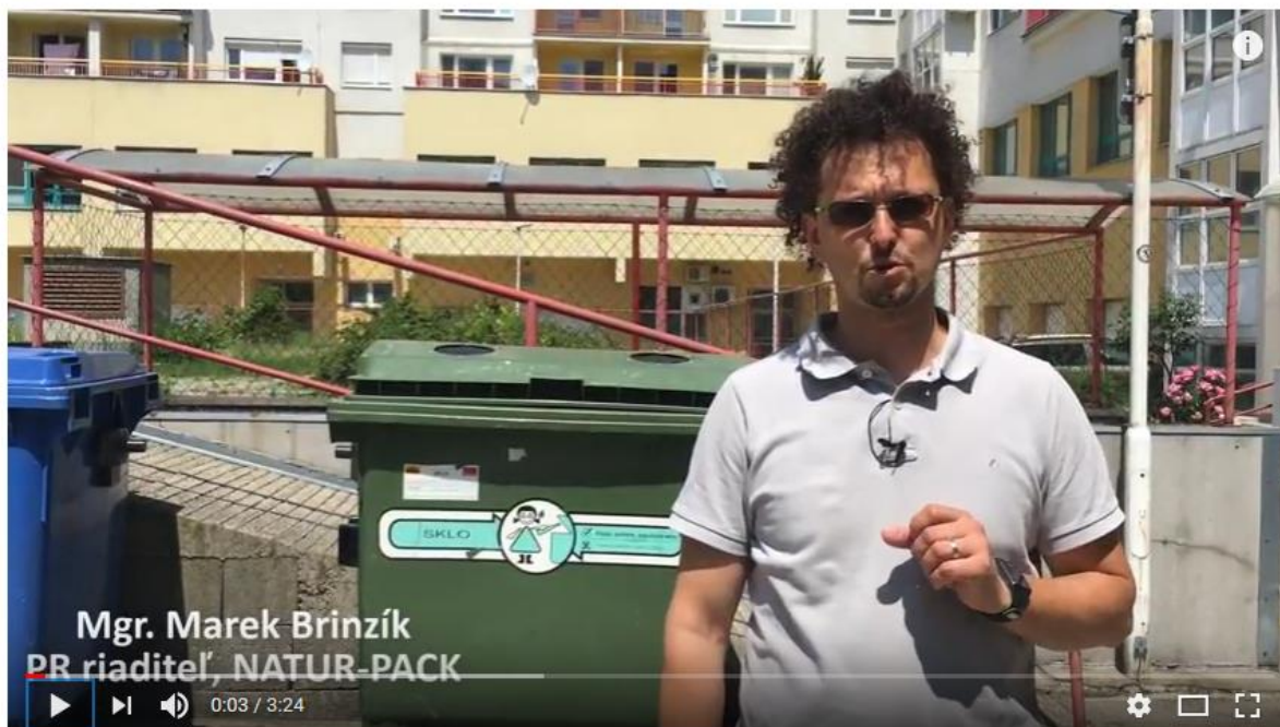
Obr. 5: Pozrite si video „Ako sa recykluje SKLO na Slovensku“, ktoré nájdete na www.naturpack.sk v sekcii Verejnosť v podsekcii Vzdelávanie .