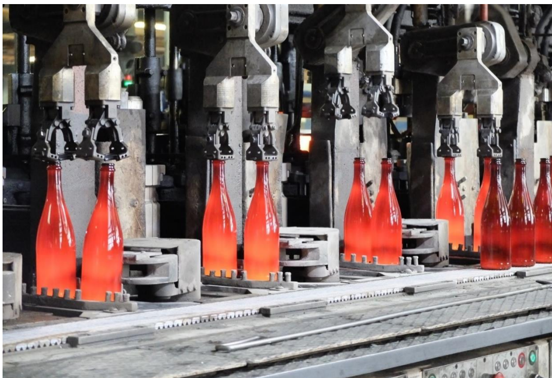
Obr. 4: čerstvá horúca fľaša z tvarovacie stroja v závode Vetropack v Nemšovej

Z roztaveného skla sa ihneď tvarujú nové produkty , napríklad sklenené fľaše alebo zaváracie poháre. Po kontrole kvality sa výrobky balia a pripravujú na transport k plničom. Celý proces, od vytriedenia skla až po jeho opätovné naplnenie, trvá približne 70 dní , pričom samotná recyklácia zaberá okolo 9 hodín.