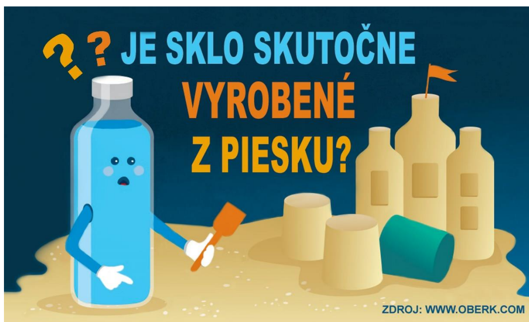
Obr. 1:

Jednoduchá odpoveď by znela „áno“. Avšak ak by bol piesok jedinou ingredienciou pri výrobe skla, okrem mušlí by boli tieto zlatisté zrnká bezpochyby ďalším dovozným artiklom z prímorských dovolenkových destinácií. Sklenená fľaša obsahuje okolo 70 až 75 % kremeňa, ktorý najčastejšie nájdeme v podobe piesku. Hlavnou ingredienciou je teda piesok, no vo všeobecnosti sú sklenené predmety vyrobené z rôznych materiálov a prímiesí. Napríklad farebnosť pridáva číremu sklu zinok, fluordidy alebo meď.